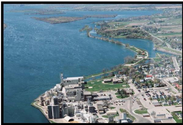
Prise d'eau de Cardinal

La prise d'eau municipale du village de Cardinal est située à 55 mètres au sud-ouest de l'usine de traitement des eaux usées, à environ 43 mètres de la rive du fleuve Saint-Laurent, à une profondeur d'environ 5,2 mètres. Le système d'eau potable de Cardinal, qui dessert environ 1650 résidents, appartient au canton d'Edwardsburgh-Cardinal qui en assure l'exploitation.