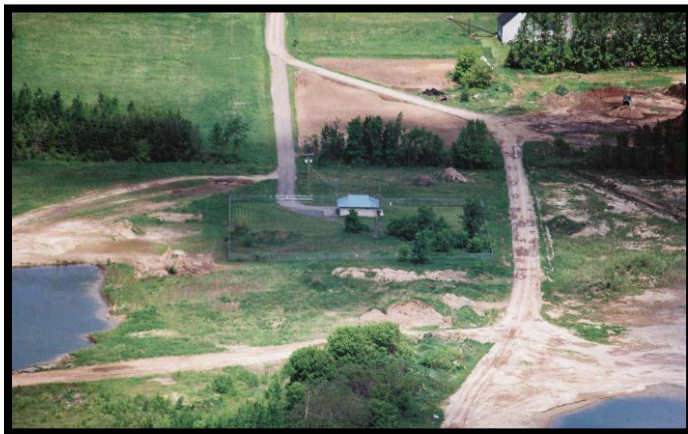
L'usine de traitement des eaux de Crysler

Le village de Crysler est situé à environ 60 km au sud-est d'Ottawa dans le canton de Stormont Nord. Le système d'eau potable de Crysler est la propriété du Canton de Stormont Nord et géré par l'Agence ontarienne des eaux (AOE). Ce système contient deux (2) puits et dessert une population d'environ 600 résidents.