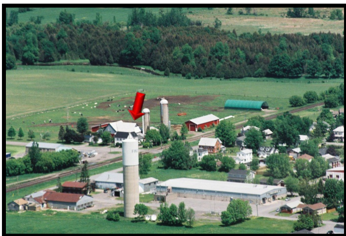
Têtes de puits de Finch

Le village de Finch est situé à environ 70 km au sud-ouest d'Ottawa dans le canton de Stormont Nord. Le système municipal d'alimentation en eau potable de Finch appartient au canton de Stormont Nord et est exploité par l'Agence ontarienne des eaux (AOE). Le champ de puits contient 2 puits et dessert une population d'environ 440 résidents.