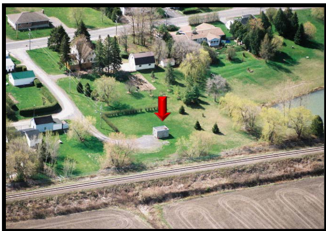
Tête de puits de Glen Robertson

Le puits de Glen Robertson, qui appartient au canton de Glengarry Nord qui en assure l'exploitation, dessert une population d'environ 100 personnes. Situé au 3342 rue Irwin dans Glen Robertson, ce système municipal d'eau potable compte parmi les 13 systèmes de la Région de protection des sources de Raisin-Nation Sud qui utilisent l'eau souterraine comme source d'eau potable municipale. Il y a 13 autres systèmes qui utilisent l'eau de surface (rivières et lacs).