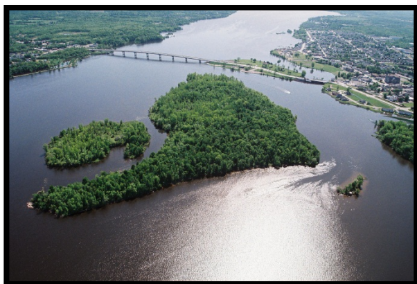
Prise d'eau de Hawkesbury dans la rivière des Outaouais

La ville de Hawkesbury est située sur la rive de la rivière des Outaouais, à environ 75 km à l'est d'Ottawa et à l'autre côté de la rivière de la province du Québec. L'usine de traitement des eaux de Hawkesbury située au 670 rue Main O. appartient à la Ville de Hawkesbury, qui gère également son opération. La prise est située à 40 mètres de la rive, à une profondeur d'environ 4.5 mètres. Ce système d'eau municipale dessert environ 14 154 résidents à Hawkesbury ainsi qu'à L'Orignal, Vankleek Hill et Laurentian Park.