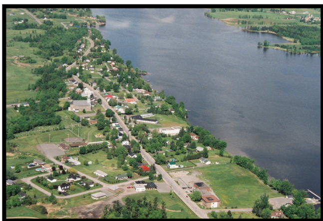
Prise d'eau de Lefavre (Rivière des Outaouais)

La station de traitement d'eau de Lefavre, qui puise son eau de la rivière des Outaouais, appartient au canton d'Alfred et Plantagenet et est exploitée par l'Agence ontarienne des eaux (AOE). La prise d'eau est située au nord de la station de traitement d'eau de Lefavre, à environ 90 m du ravin et à une profondeur de 15 m. Le système dessert une population d'environ 4 500 résidents et comprend les municipalités d'Alfred, de Plantagenet et de St-Isidore. Ce système d'eau potable est parmi l'un de 13 systèmes qui puisent de l'eau de surface provenant des rivières ou des lacs de la Région de protection des sources de Raisin-Nation Sud.