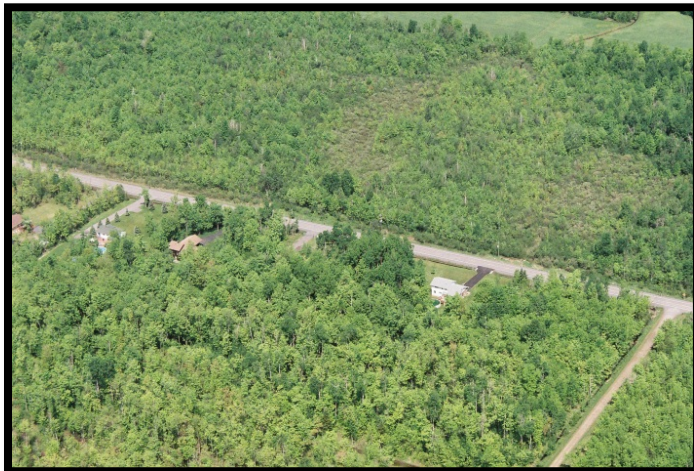
Têtes de puits de Limoges

Le village de Limoges est situé dans le canton de Nation. Appartenant à la municipalité de la Nation et exploitée par SIMO, les deux puits desservent une population d'environ 3 300 personnes. Les têtes de puits de Limoges sont situées à 1,3 km des puits municipaux qui alimentent le village de Vars. Les deux systèmes s'approvisionnent en eau potable à partir du système aquifère de l'esker de Vars-Winchester.