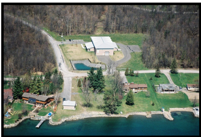
Prise d'eau de Long Sault, Stormont Sud

Le système municipal d'approvisionnement en eau potable et le système de traitement de l'eau du village de Long Sault sont situés sur l'île Moulinette, au sud du village de Long Sault. La prise d'eau se trouve dans le fleuve St-Laurent et est située à environ 137 m du rivage. L'eau est puisée d'une profondeur d'environ 8 m. Le système régional de traitement de l'eau de Long Sault et Ingleside appartient au canton de Stormont Sud et est exploité par l'entreprise Caneau Water and Sewage Operations Inc. Cette installation alimente en eau potable environ 3 500 résidents de Long Sault, Ingleside, Wales et Osnabruck Centre.