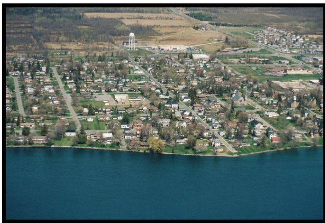
Prise d'eau de Morrisburg (Fleuve Saint-Laurent)

La prise d'eau municipale de la ville de Morrisburg est située à l'extrémité sud de la rue Augusta, à l'ouest des limites de la ville, dans le fleuve St-Laurent. L'eau brute est prélevée à environ 2,75 m du fond de la rivière. La profondeur normale de l'eau au-dessus d'une prise d'eau est à environ 8 m. Le système régional de traitement de l'eau de Dundas Sud appartient au canton de Stormont Sud et est exploité par l'entreprise Caneau Water and Sewage Operations Inc. Cette installation dessert les villages de Morrisburg et Iroquois respectivement, et alimente en eau potable environ 3 938 résidents dans ces deux communautés.