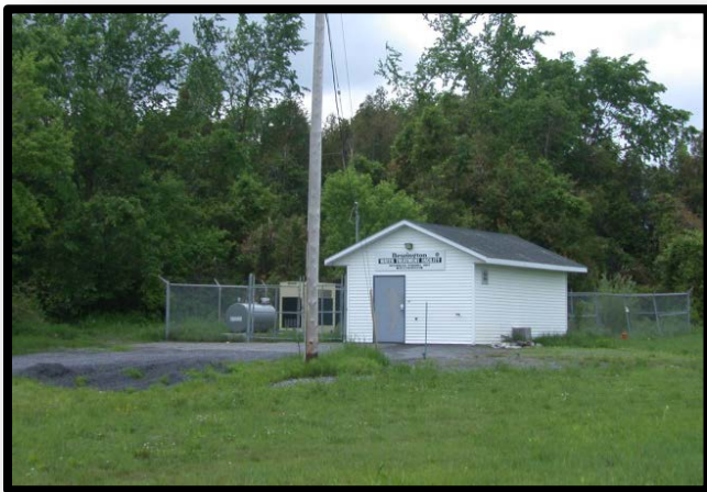
Têtes de puits de Newington

Le village de Newington est situé à environ 25 km au nord-est de Cornwall dans le canton de Stormont Sud. Les têtes de puits de Newington appartiennent au canton de Stormont Sud alors qu'elles sont opérées par Caneau Water and Sewage Operations Inc. Les deux puits de Newington desservent une population d'environ 260 résidents.