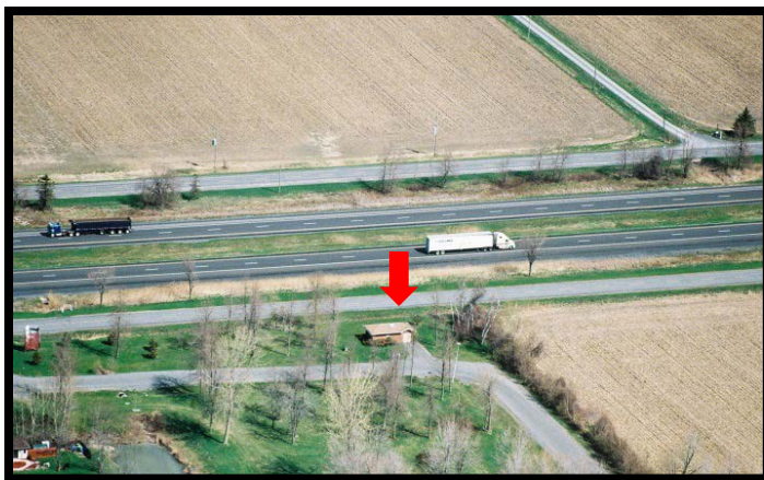
Tête de puits de Redwood Estates

Le puits de Redwood Estates, qui appartient au canton de Glengarry Sud qui en assure l'exploitation, a été construit en 1995 pour desservir une population de 150 et soutenir un total de 39 lots résidentiels. Ce système municipal d'eau potable compte parmi les 13 systèmes de la Région de protection des sources de Raisin-Nation Sud qui utilisent l'eau souterraine comme source d'eau potable municipale. Il y a 13 autres systèmes qui utilisent l'eau de surface (rivières et lacs).