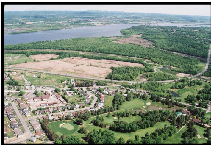
Prise d'eau de Clarence-Rockland (Rivière des Outaouais)

La Cité de Clarence-Rockland est située à environ 40 km à l'est de la Ville d'Ottawa. La prise d'eau municipale, qui appartient à la Cité de Clarence-Rockland, est située dans le Fleuve Saint-Laurent à une profondeur de 9.1 mètres et à 65 mètres de la rive. En plus de Rockland, cette installation dessert Hammond, Bourget, Saint pascal de Baylon, Cheney et Clarence-Creek. Le système d'eau municipal dessert approximativement 13 500 résidents.