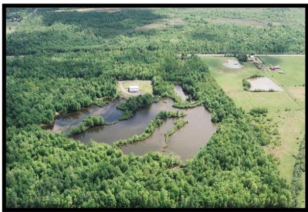
Tête de puits de Vars

Le village de Vars est situé dans la partie est de la ville d'Ottawa. Les deux puits appartiennent à la ville d'Ottawa qui en assure l'exploitation. Ces puits desservent une population d'environ 1130 personnes. Les têtes de puits de Vars se trouvent à 1,3 km des puits municipaux qui alimentent le village de Limoges. Les deux systèmes s'approvisionnent en eau potable à partir du système aquifère de l'esker de Vars-Winchester.