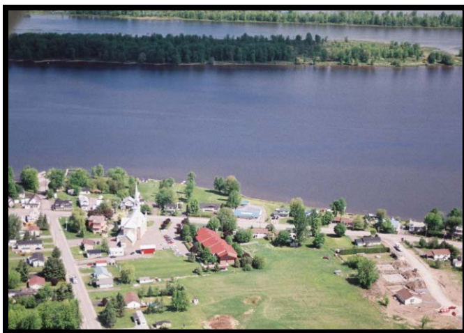
Prise d'eau de Wendover (Rivière des Outaouais)

La station de traitement d'eau de Wendover, qui puise son eau de la rivière des Outaouais, appartient au canton d'Alfred et Plantagenet et est exploitée par l'Agence ontarienne des eaux (AOE). La prise d'eau est située sur la Route 17, au nord de la station de traitement d'eau de Wendover, à environ 100 m du rivage et à une profondeur de 4 m. Le système d'eau dessert une population d'environ 850 résidents. Ce système d'eau potable est parmi l'un de 13 systèmes qui puisent de l'eau de surface provenant des rivières ou des lacs de la Région de protection des sources de Raisin-Nation Sud.