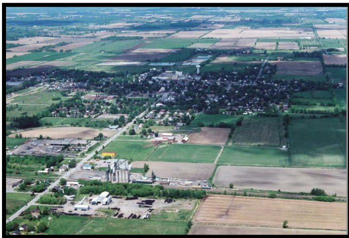
Têtes des puits de Winchester

Le système municipal d'approvisionnement en eau potable du village de Winchester est une combinaison de quatre champs de puits distincts et comporte six têtes de puits. Les puits de production de Winchester appartiennent au canton de Dundas Nord et sont exploités par l'Agence ontarienne des eaux (AOE). Ce système dessert une population d'environ 2 300 personnes.