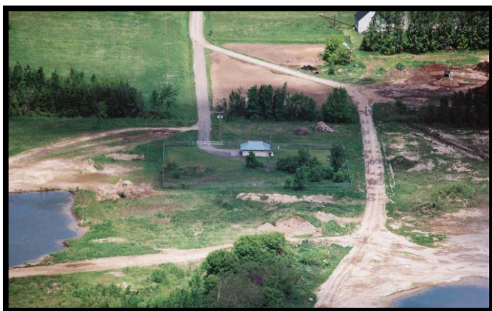
Systeme d'eau potable d'Embrun

Les villages d'Embrun, Marionville et Russell sont situés à approximativement 50 km au sud-est d'Ottawa, dans le canton de Russell. Le canton de Russell appartient et opère les puits de production afin de desservir environ 6423 résidents d'Embrun, 3718 personnes à Russell, et 341 résidents dans la communauté de Marionville pour un total de 10 482 personnes. Le champ de puits est situé à environ 3 km à l'est de Marionville.