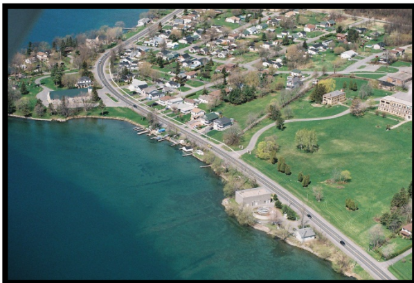
Prise d'eau de Glen Walter (Chemin de comté 2, South Glengarry)

Le système de traitement de l'eau de Glen Walter, qui appartient au canton de Glengarry Sud qui en assure l'exploitation, est situé sur le chemin de comté 2, à environ 2 km à l'est de Cornwall. L'eau municipale est puisée du fleuve St-Laurent et la prise d'eau est située à environ 390 m du rivage, à une profondeur de 8 m. Le système est conçu pour desservir une population de 1 080 personnes, et dessert actuellement environ 850 personnes par le biais de 350 entrées de service. Ce système d'eau potable compte parmi les 13 systèmes qui puisent de l'eau de surface dans les rivières ou les lacs de la Région de protection des sources de Raisin-Nation Sud.