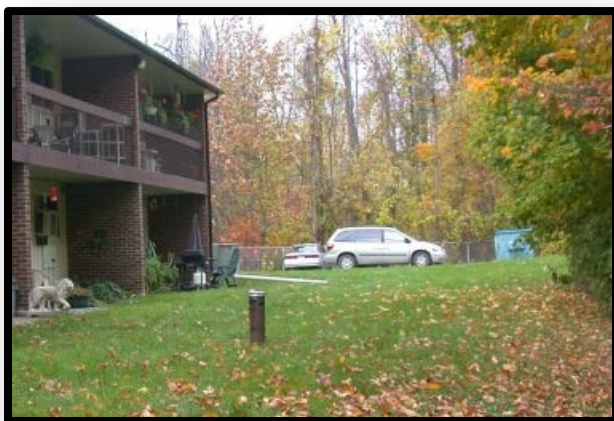
Tête de puits de Spencerville

Le village de Spencerville est situé à environ 75 km au sud d'Ottawa. Dans le village, un puits fournit l'eau pour un bâtiment de 15 unités sur la rue Bennett. Couramment surnommé « puits de la rue Bennett », ce système d'eau potable appartient au Comtés unis de Leeds et Grenville, et est géré par les Services Environnementaux d'Edwardsburgh-Cardinal.